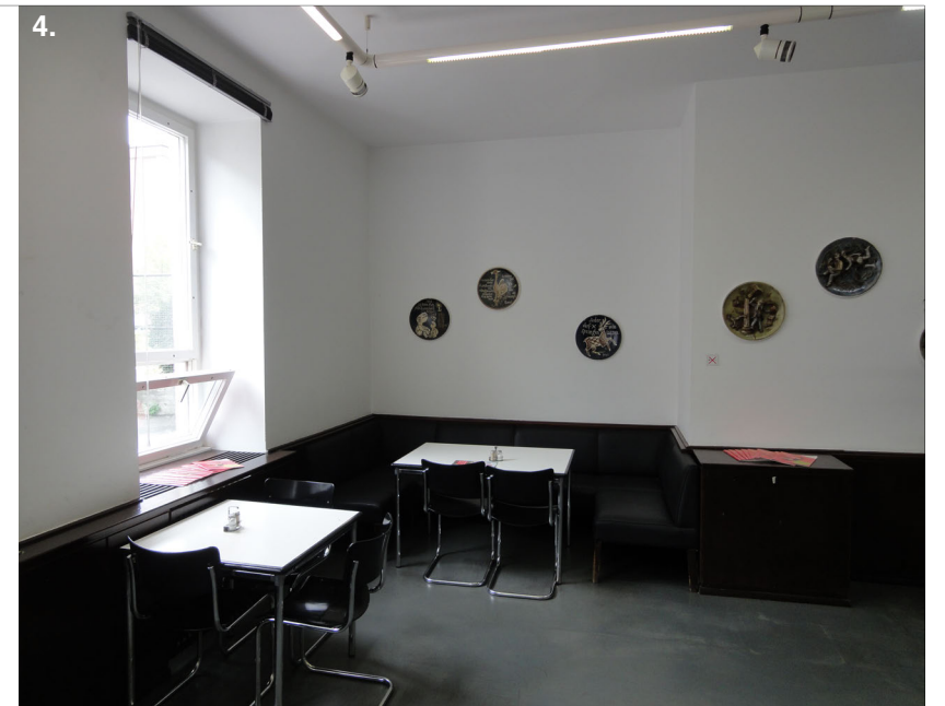
Ausschankraum (4.) und Mensa (2.) heute - Furniere überstrichen