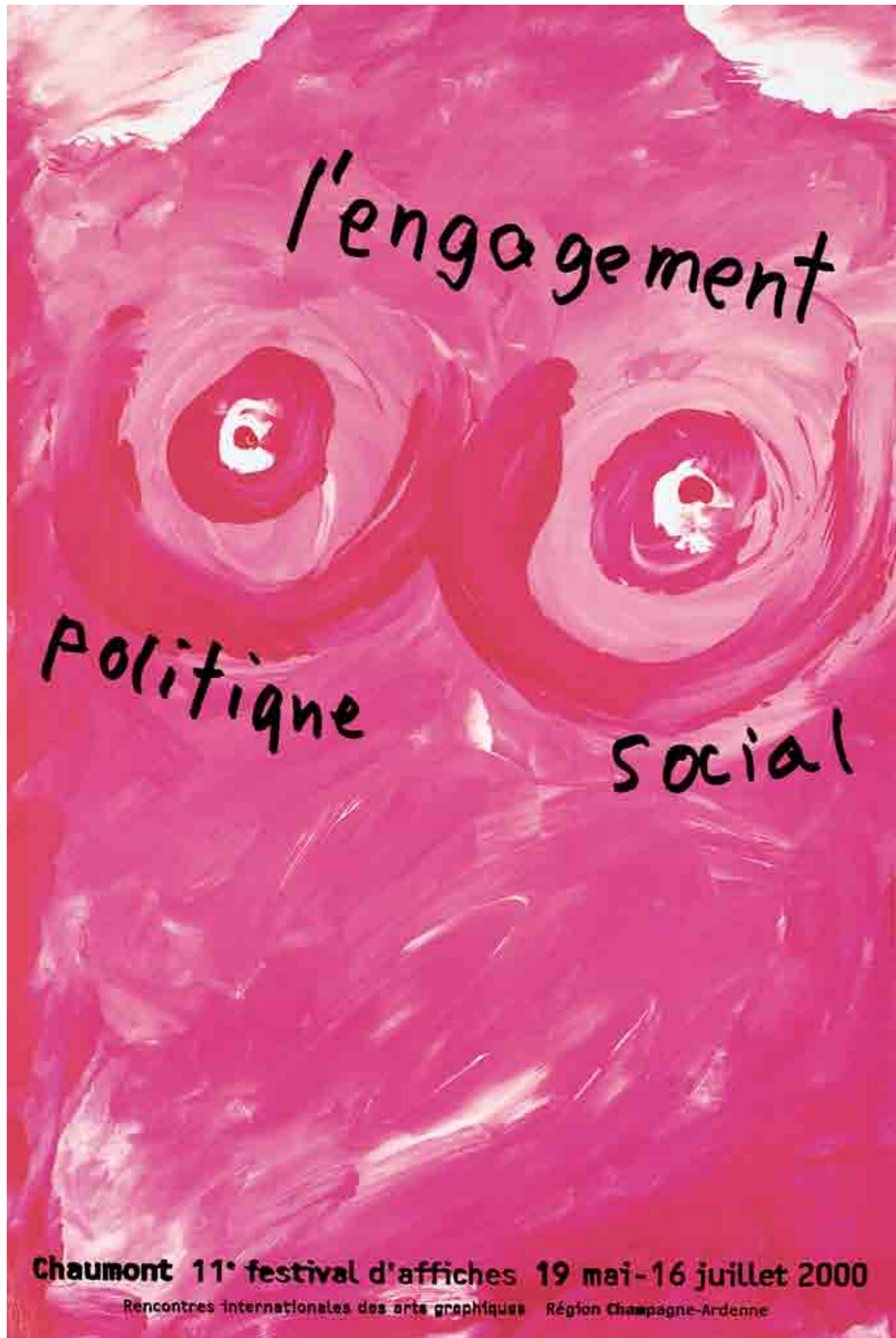
Plakatfestival Chaumont (Nous Travaillons Ensemble)