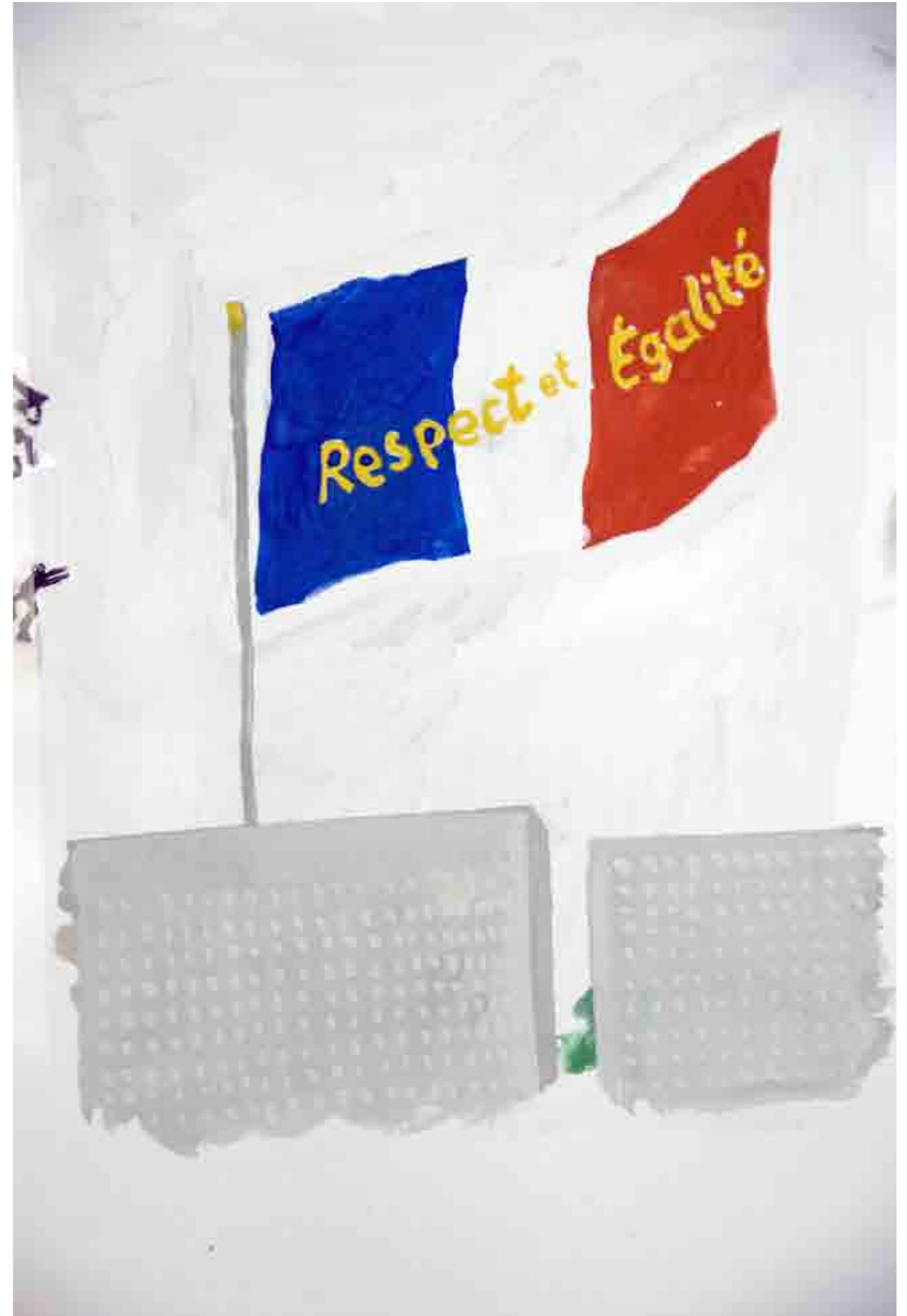
Respekt und Gleichheit (Nous Travaillons Ensemble)