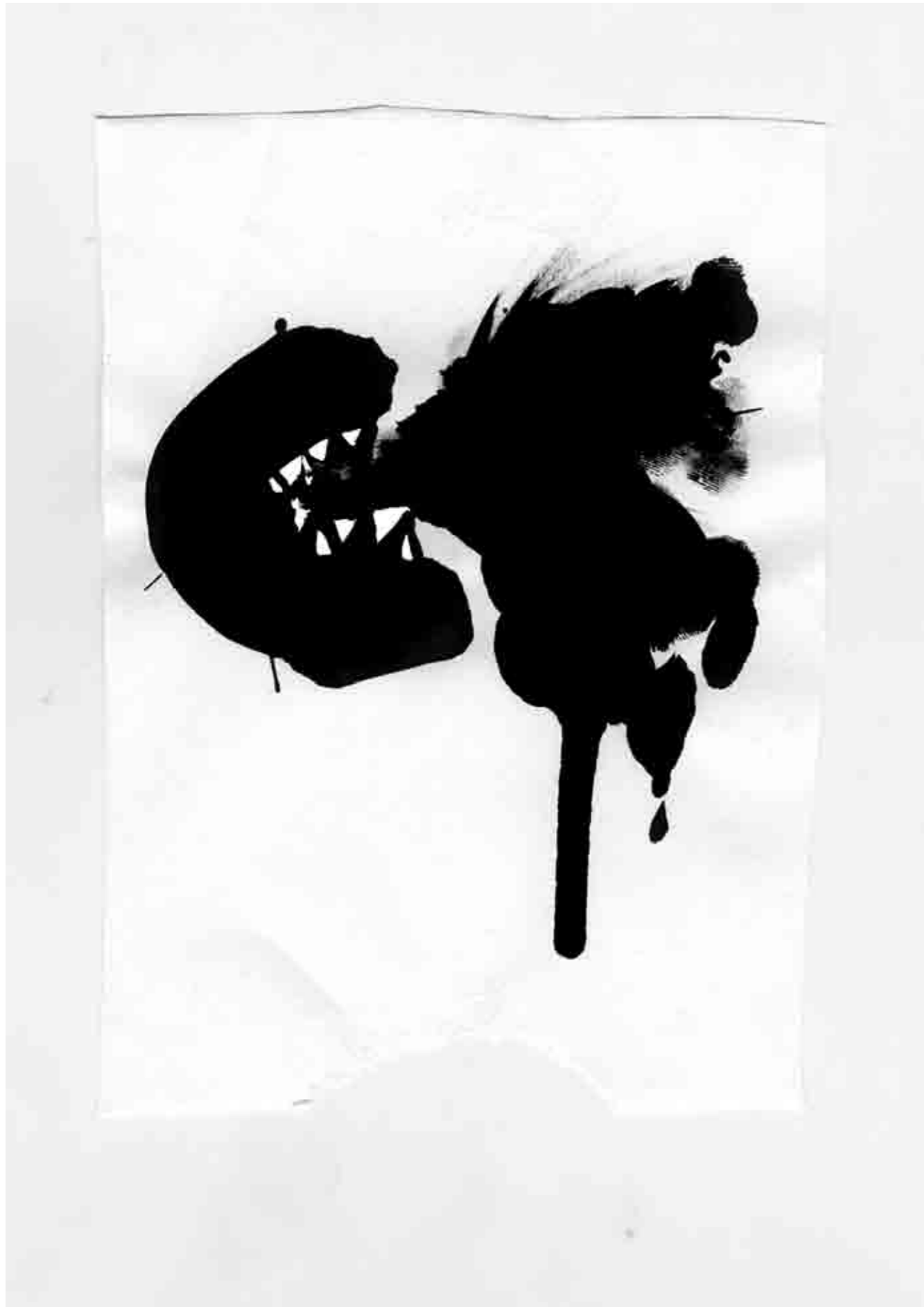
(Nous Travaillons Ensemble)