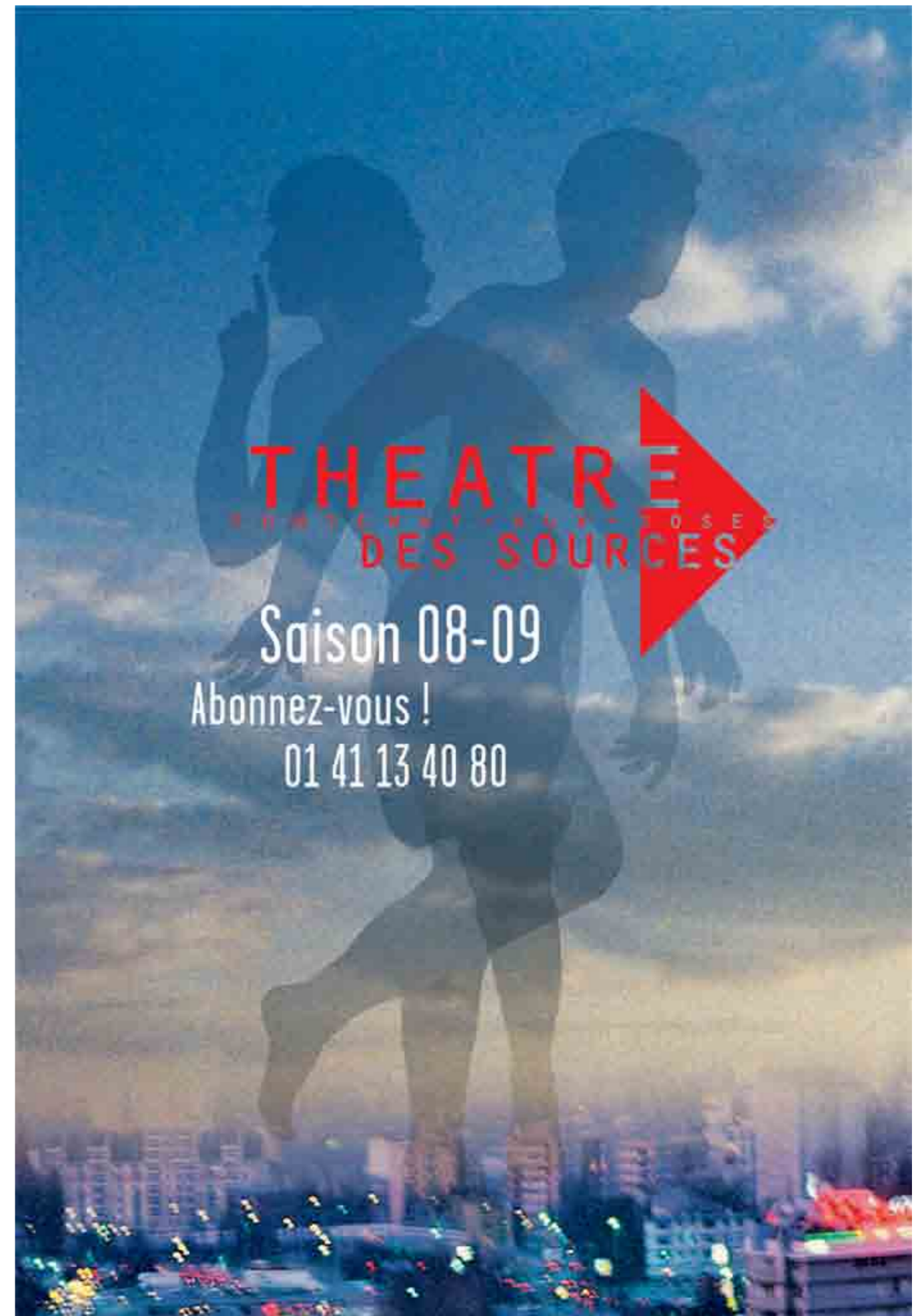
Theatersaison (Nous Travaillons Ensemble)