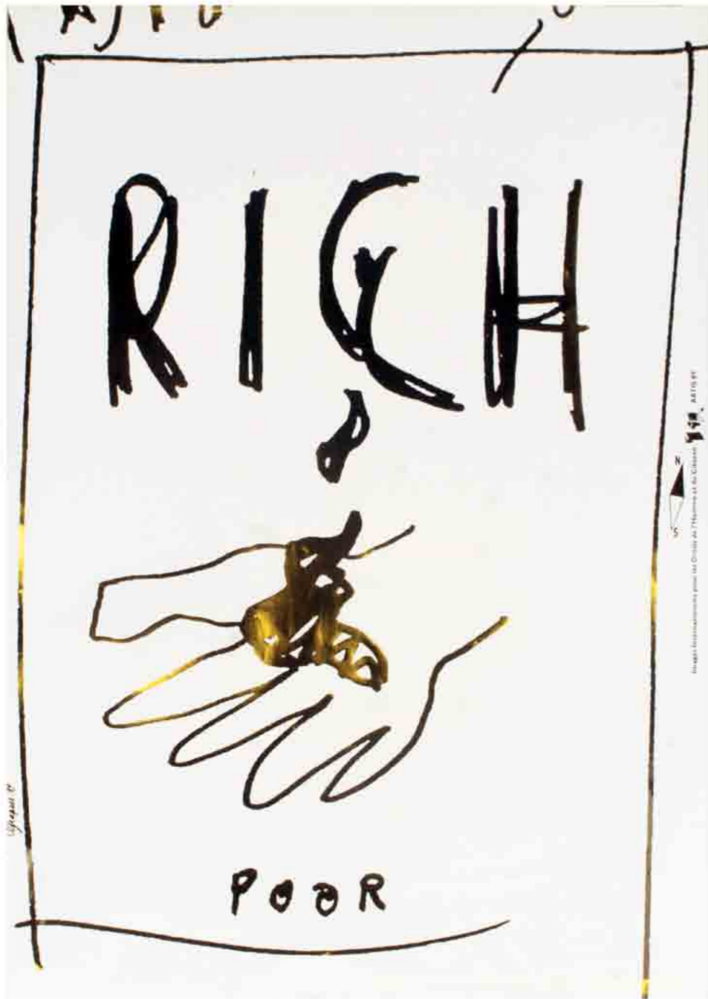
Reich, arm (Grapusplakat)