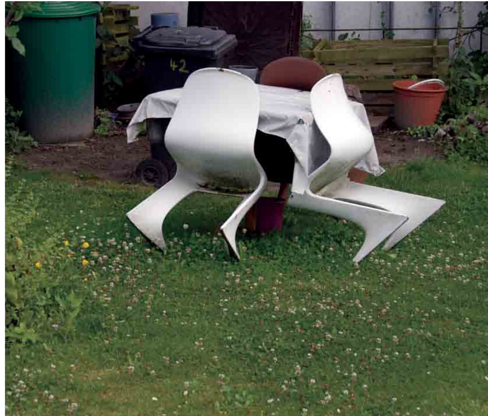
Berlin 2014