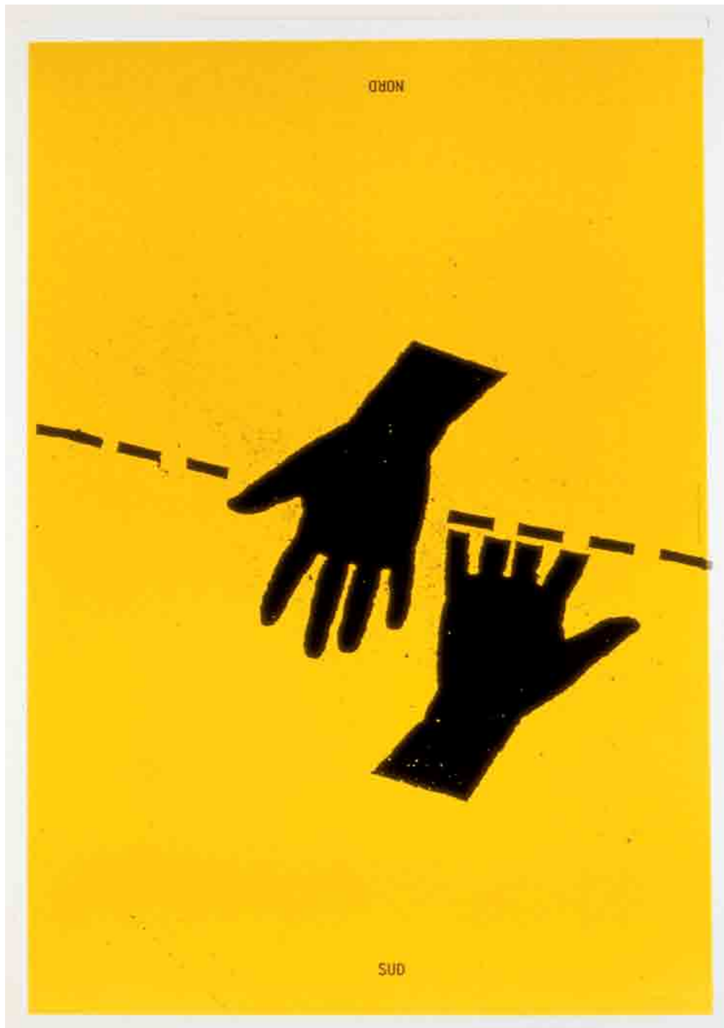
Plakat (Grapus / Nous Travaillons Ensemble)