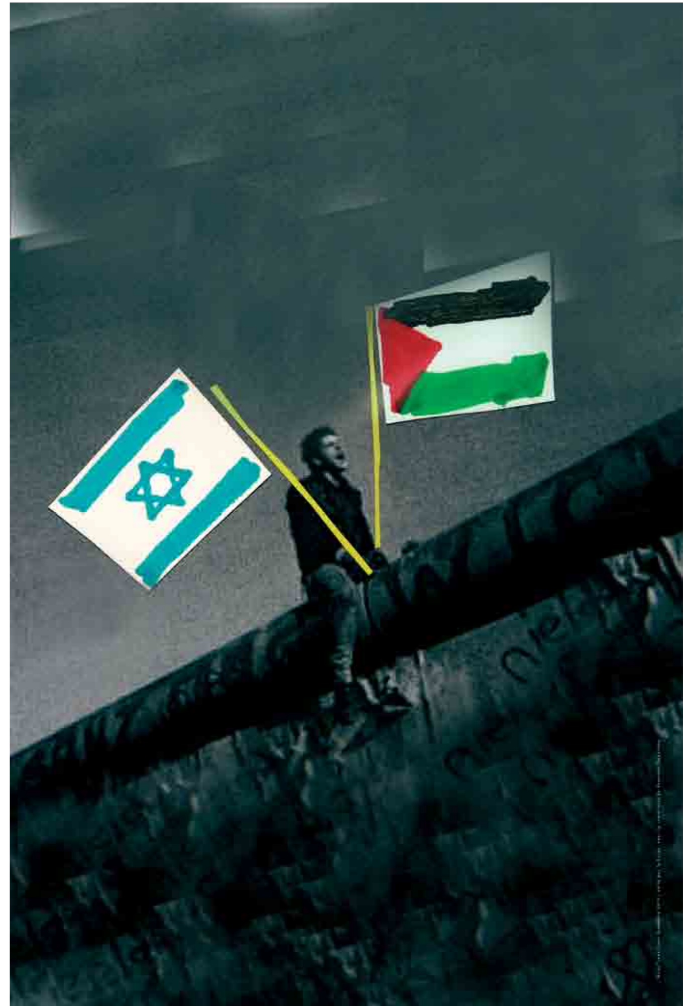
Plakat 20. Jahrestag Fall der Mauer (Nous Travaillons Ensemble, Foto R. Depardon)