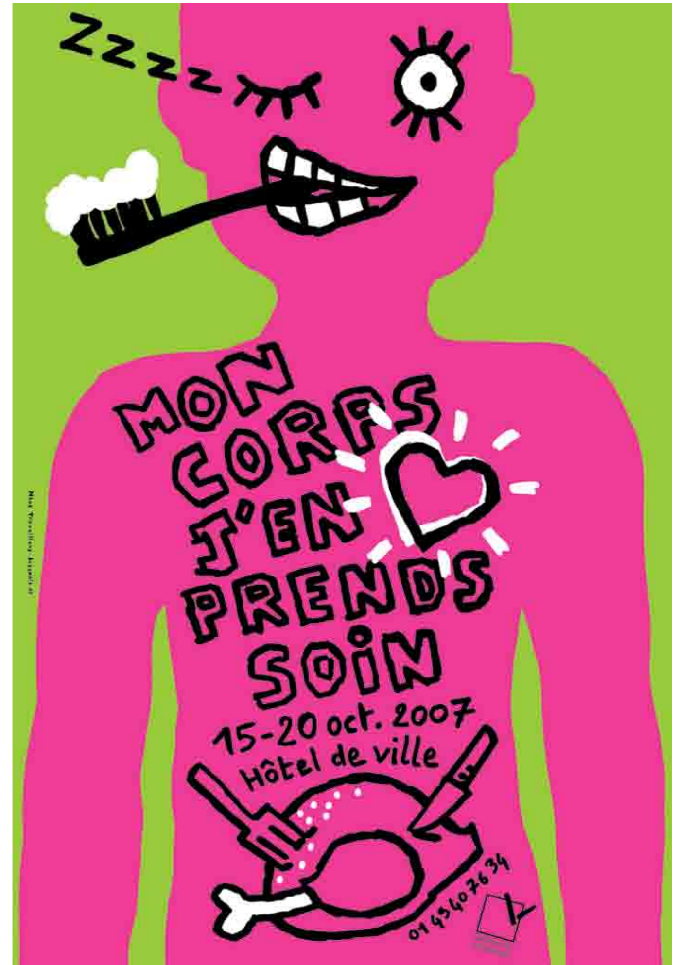
Ich kümmer' mich um meinen Körper (Nous Travaillons Ensemble)