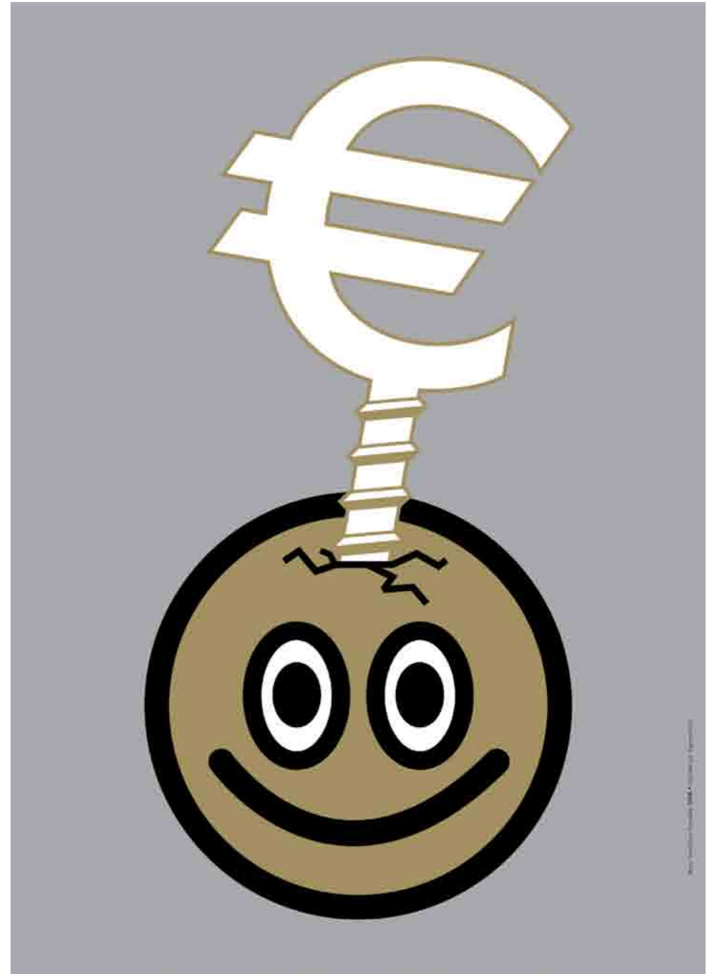
Neujahrspakat (Nous Travaillons Ensemble)