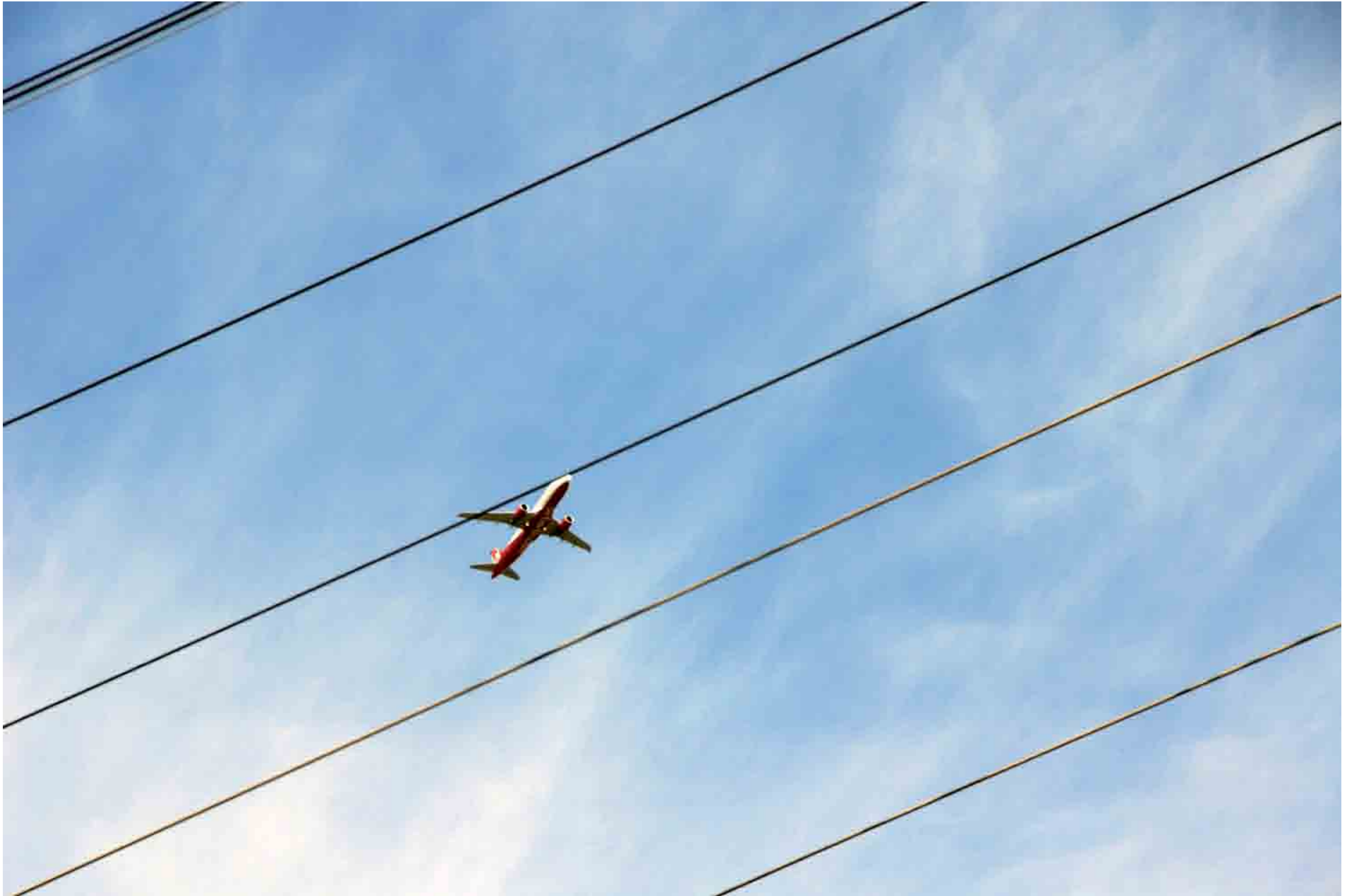
BER Berlin